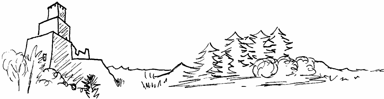
Grimburg → Die eigentliche Burg von Robin

Und warum ich euch schreibe werdet ihr jetzt erfahren.